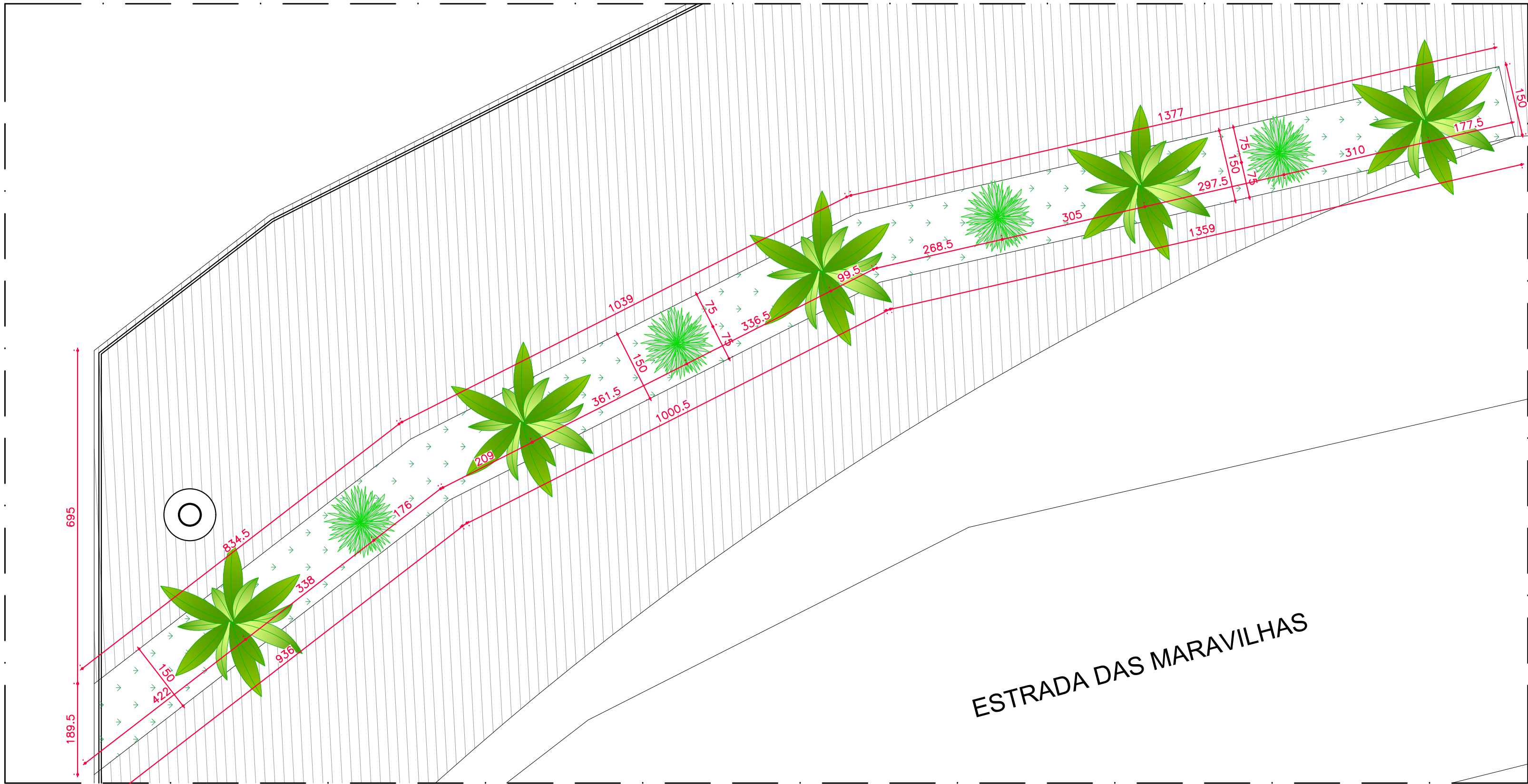
DETALHE - PAISAGISMO AMPLIAÇÃO ESC 1/75