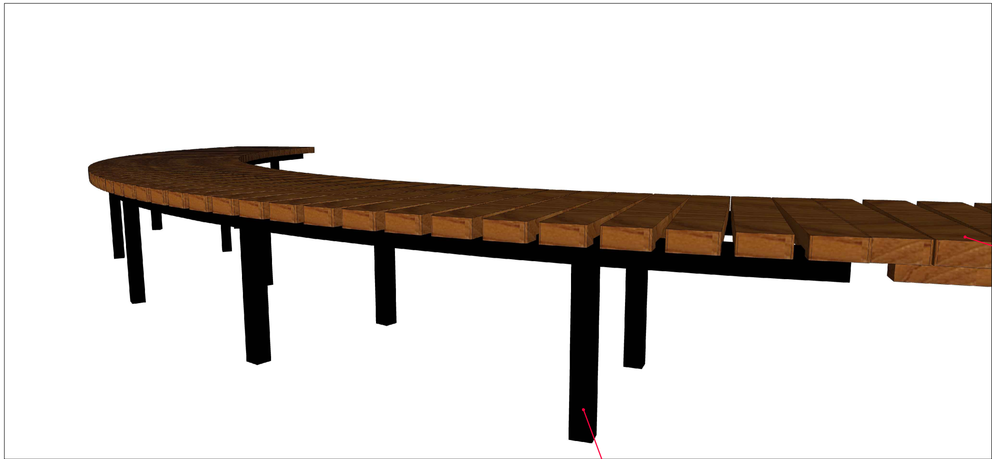
DETALHE BANCO CURVO ESC SEM ESCALA